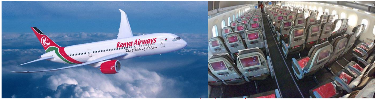
(บริการอาหารและเครื่องดื่มบนเครื่อง)

15.00 น. นำท่านบินลัดฟ้าสู่ เมืองกวางเจา โดยสายการบิน KENYA AIRWAYS เที่ยวบินที่ KQ 886